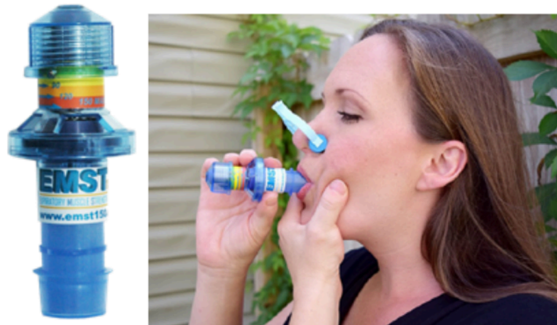
Figura 1: Dispositivo para entrenamiento muscular de la fuerza espiratoria (EMST150).