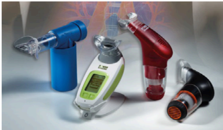
Figura 2: Dispositivo para entrenamiento muscular de la fuerza inspiratoria (PowerBreath).

Estos dispositivos proporcionan un nivel de presión constante que puede ser controlado y ajustado por el clínico o el investigador. Los aparatos están compuestos típicamente por diferentes estructuras: una válvula unidireccional ajustable, un resorte y una boquilla a través de la cual se debe producir una determinada presión inspiratoria y/o espiratoria para respirar. Estos dispositivos pueden utilizarse para trabajar el fortalecimiento de músculos de la inspiración o espiración, dependiendo del objetivo de trabajo [19].