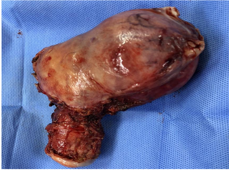
FIGURA 2: Pieza quirúrgica, no se observa infiltración de serosa.