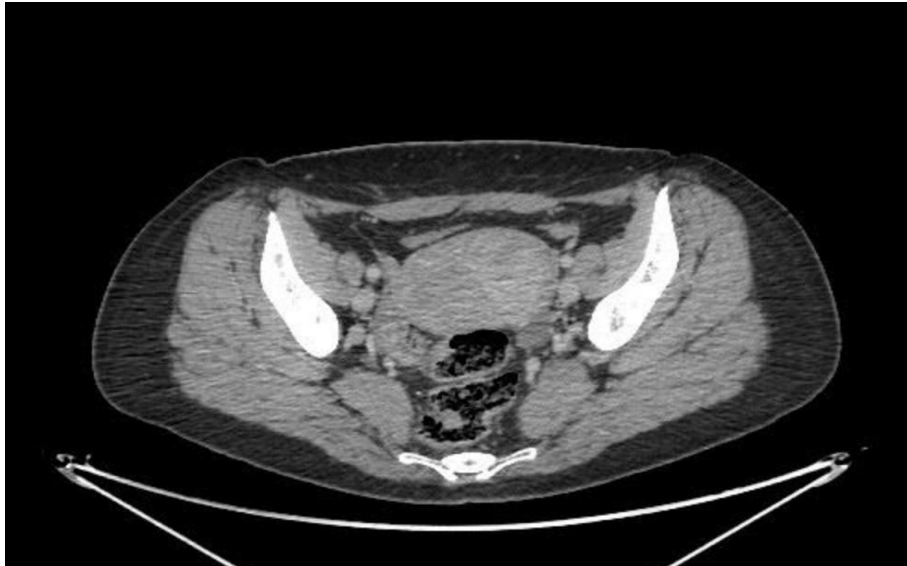
FIGURA 1. a: CT sin marcación de tumor pélvico